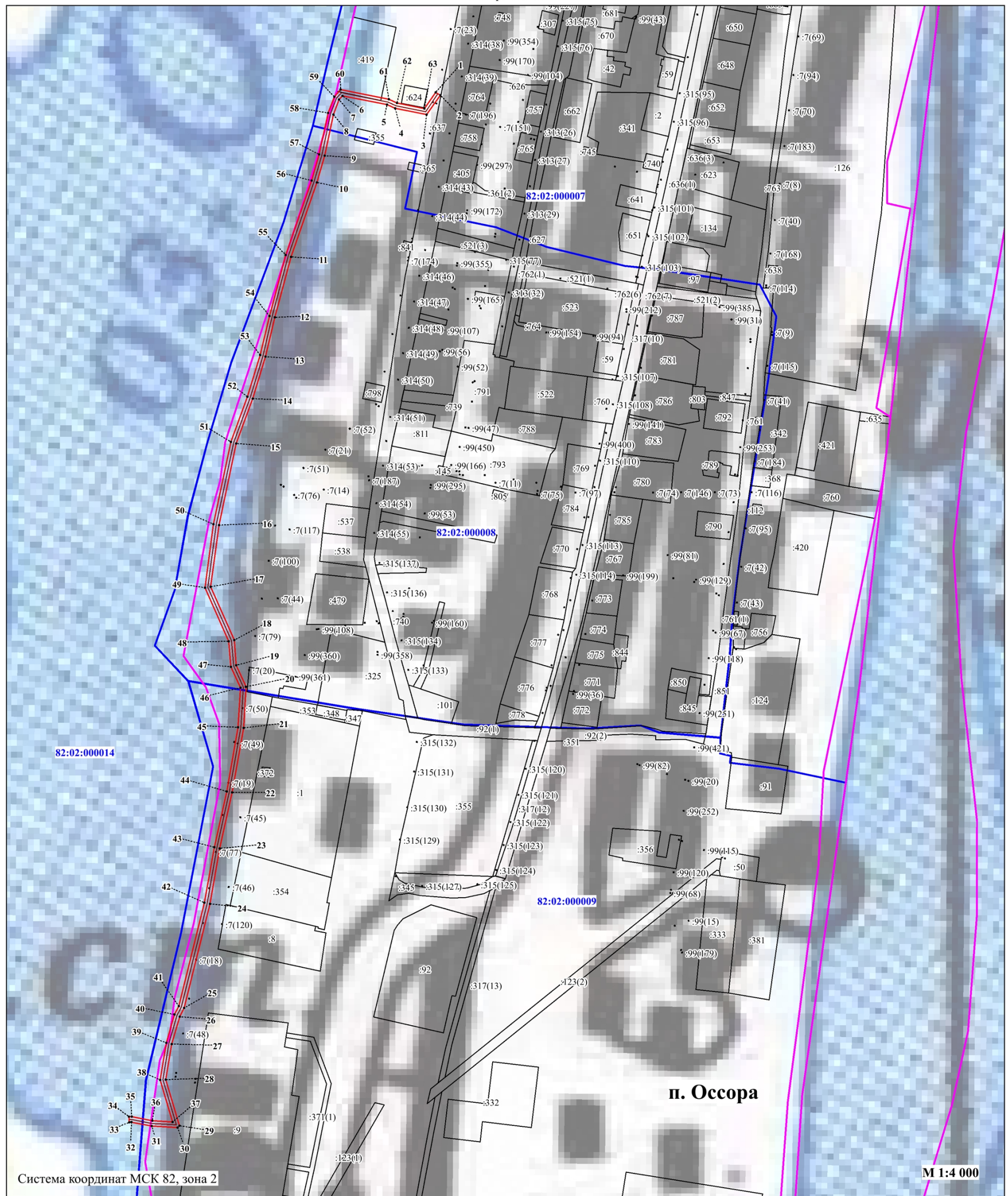
План границ объекта